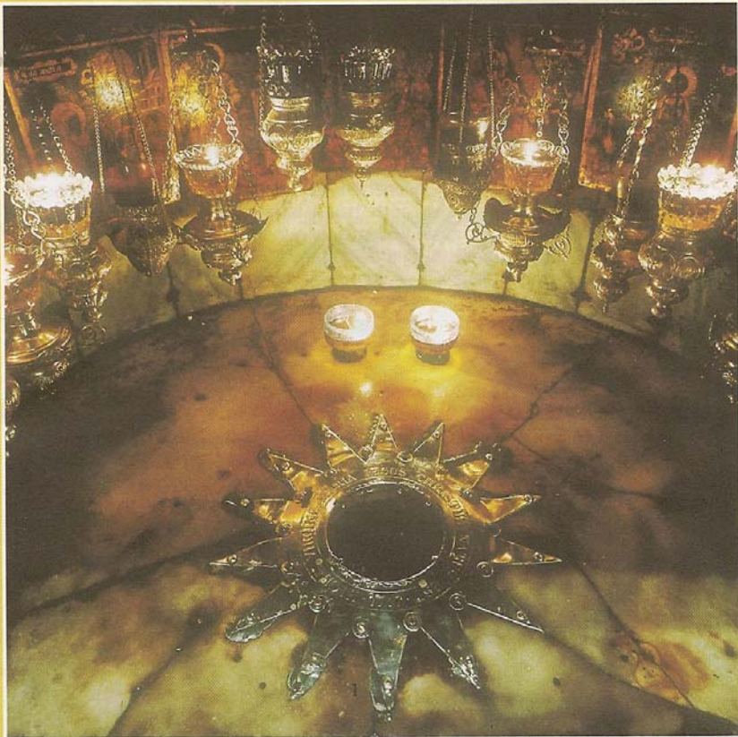
Hier ist Gott Mensch geworden: Geburtskirche Betlehem; Foto: © picture-alliance/akg-images/Erich Lessing